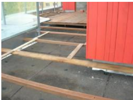
jako nosné stojky pro trámy