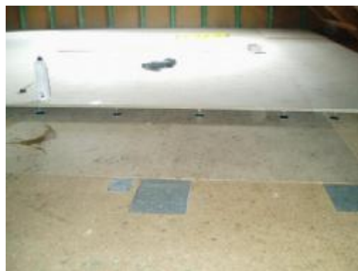
nová podlaha v půdní vestavbě