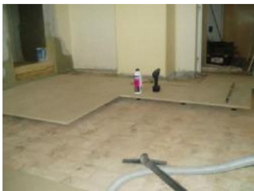
výškové vyrovnání podlahy při rekonstrukci