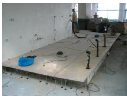
jako pódium pro bar

Katalogová cena bez DPH: (konečnou cenu Vám sdělíme na základě celkového odběrného množství)