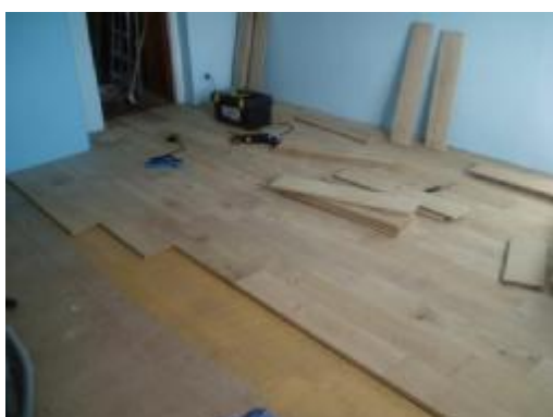
položení finální krytiny na podlahové desky na stojkách