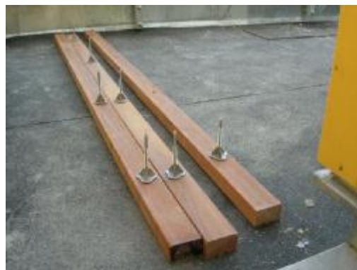
detail stojky v trámu